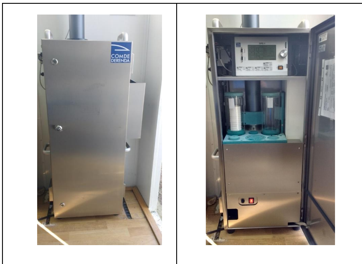
Figura 8. Captador Gravimétrico Derenda PNS-18T-DM

En la figura 8, se presenta el captador gravimétrico que fue empleado para la medición de PM 10 .