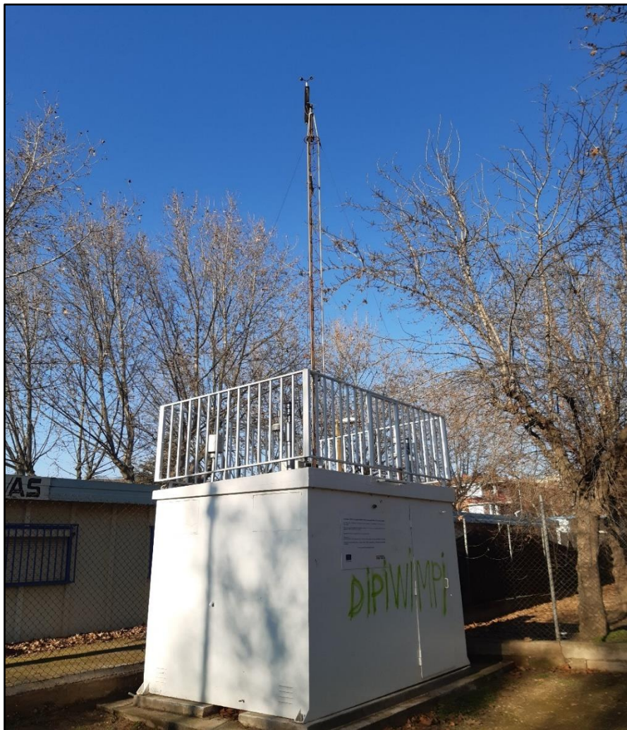
Figura 10. Punto de muestreo